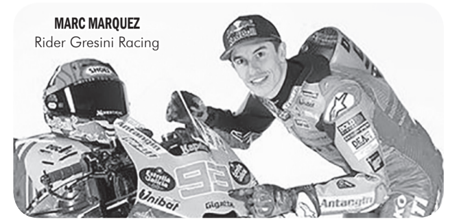
MARC MARQUEZ Rider Gresini Racing

melihat Marc juga datang dari belakang, jadi saya memimpin secepat mungkin untuk memastikan bahwa itu adalah masalah Pecco, bukan masalah saya. Sejak saat itu, saya berjuang dengan diri saya sendiri untuk mendapatkan lap yang baik," ujarnya. • vdp