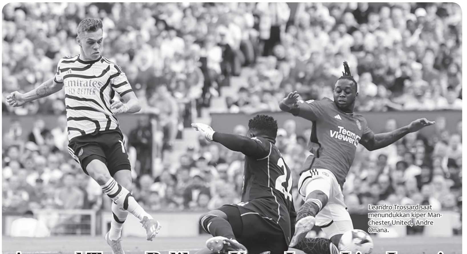
Leandro Trossard saat menundukkan kiper Manchester United, Andre Onana.