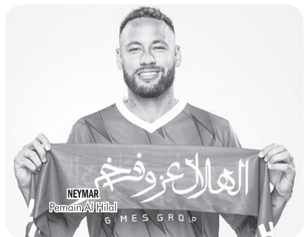
NEYMAR Pemain Al Hilal

"Saya amat gembira. Memenangi gelar selalu bagus. Hal terbaik jelas bermain di lapangan, namun saya turut senang untuk rekan setim saya. Saya baik-baik saja. Saya merasa sehat. Saya tak sabar untuk kembali ke lapangan. Para supporter sungguh luar biasa. Sayangnya, saya belum bisa memberikan kebahagiaan yang pantas mereka dapatkan, namun Anda boleh merasa yakin bahwa musim depan kami akan bersenang-senang," kata Neymar soal gelar juara Al Hilal, dikutip ESPN. • vit